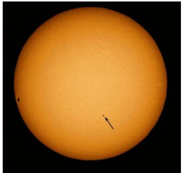
Abb. rechts: Merkurtransit am 7. Mai 2003.

Gelegentlich sind Merkurdurchgänge vor der Sonne zu beobachten. Über solche Ereignisse informieren die astronomischen Jahrbücher. Die nächsten in Europa sichtbaren Transits finden am 9. Mai 2016 und am 11. November 2019 statt.